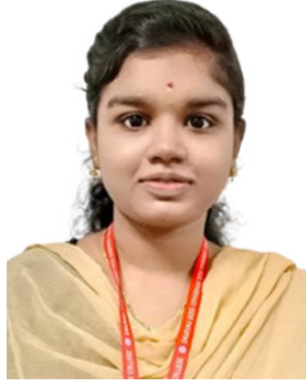
செ. சந்தோஷ் முதலாம் ஆண்டு பொருளியல் துறை